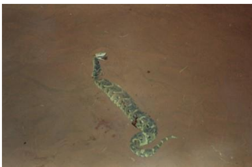
Surucucu morta na CTm5