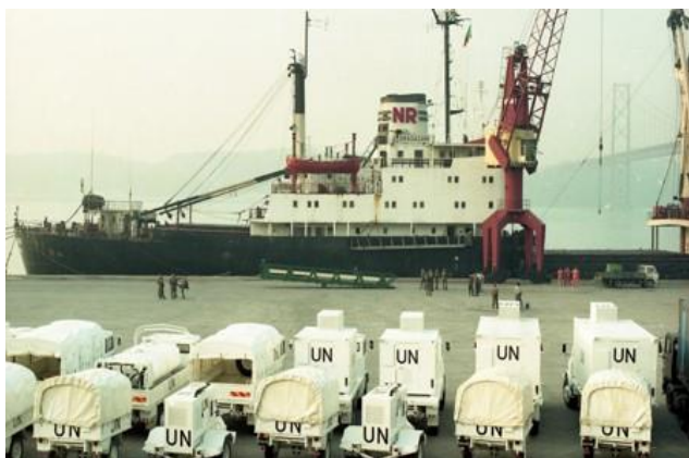
Navio DRAGAZANI fretado pelas Nações Unidas para transportar o material da CTm5

O DRAGAZANI além de ser um navio velho e sem condições, especialmente as higiénico-sanitárias [velho e imundo], mas o preço cobrado às Nações Unidas talvez fosse o mais vantajoso.