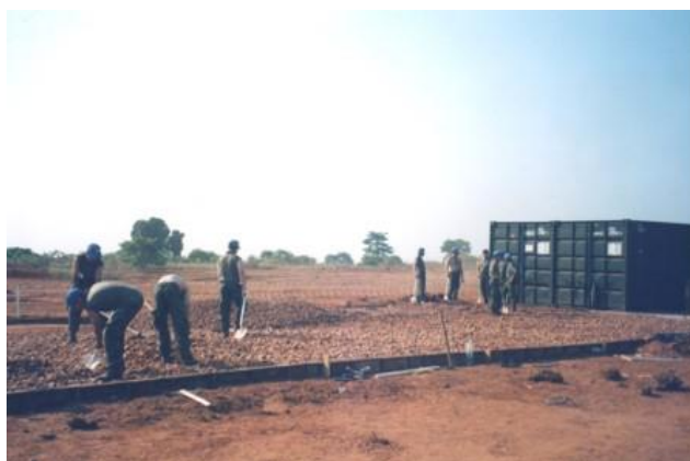
Construção da laje do refeitório geral e do bar da CTm5

Esta placa foi executada sem utilização de nenhuma máquina, nem sequer uma betoneira, por isso, o betão foi “grudado” à pá e enxada pelos militares da unidade com muito empenho e suor à mistura.