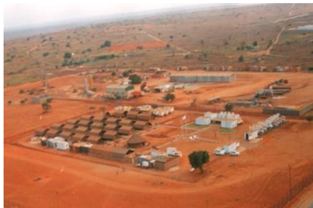
Fotografia aérea da CTm5

No dia 10 de junho foi inaugurado o aquartelamento da CTm5, organizado ao estilo CANIFA 1 , com áreas especificamente definidas para os vários setores da unidade, nomeadamente: porta de armas e área de estacionamento de viaturas; parada da unidade; área de apoio de serviços (cozinha, contentores frigoríficos, refeitório-geral, bar, enfermaria, barbearia, lavandaria e sanitários); área de alojamento dos militares (Tendas 16P); área de comando, estado-maior (pessoal, informações e operações, logística), comando dos Pelotões de transmissões e de apoio de serviços, e centro de comunicações; área de manutenção, grupos geradores de eletricidade e arrecadações (de viaturas, de material de transmissões e elétrico).