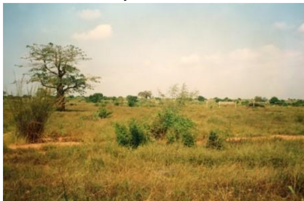
Área destinada à instalação da CTm5 (antes de ser terraplanada)