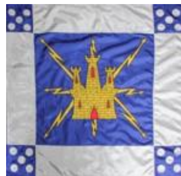
Estandarte do BTm4

É uma canção melancólica de alguém que ama devotadamente a sua pátria – Portugal, mas que agora vai ajudar a construir a paz num país nosso irmão - Moçambique. Na sua génese, esta “Saudade” caracteriza a alma lusa, ainda agora partiu, mas já está cheio de saudades do seu retângulo natal.