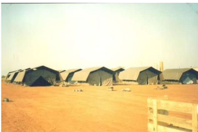
Tendas 16/P onde dormiam os militares da CTm5

terraplanado de terra vermelha, onde o vento levantava o pó e o sol insuportável tornava mais difícil os trabalhos diários.