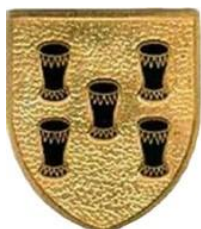
Brasão de Armas da CTm5

Os tambores são a mais antiga forma de comunicação que foi usada em África, sendo por isso incluídos no Brasão de Armas da CTm5; uma Companhia de Transmissões disponibilizada por Portugal às Nações Unidas para integrar a UNAVEM III, em Angola, e garantir as suas comunicações na área de missão.