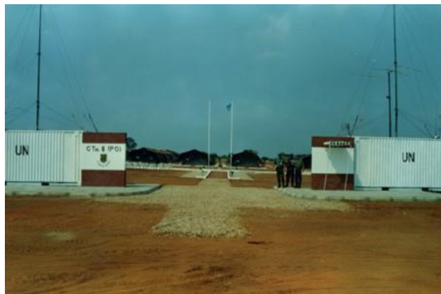
CTm5 vista da sua Porta de Armas, 10 de junho de 1995